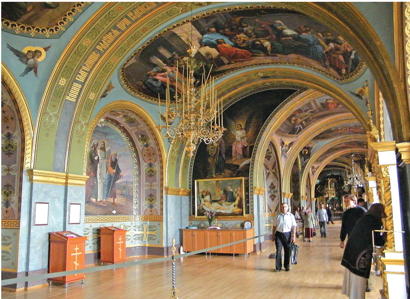
Підземний храм Іова Почаївського Свято-Почаївської лаври